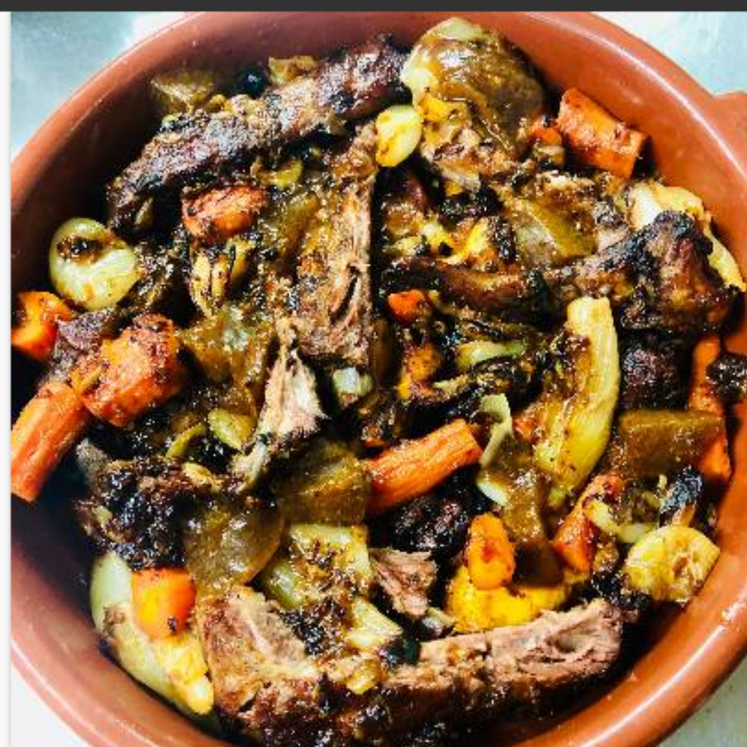
Rostit de pagès