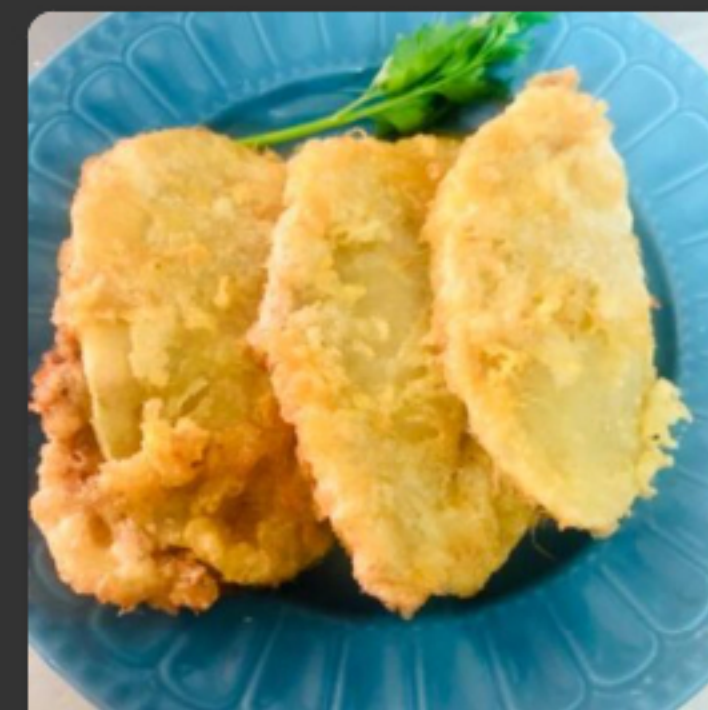
Patates farcides de carn