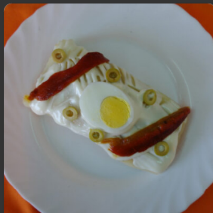
Bracet de patata